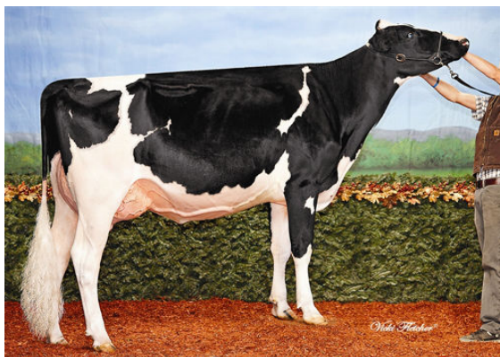
RALMA-RH MANOMAN BANJO FIFTH DAM