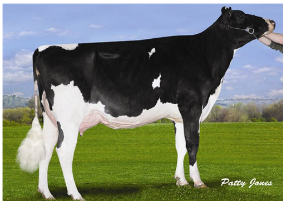
MS LOOKOUT PESK BKM BRIA FOURTH DAM